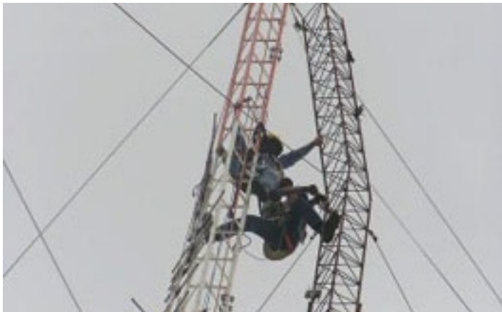
Membros da equipe técnica da TWR, efetuando a troca de uma torre de 38 metros de altura, na Suazilândia, em 29 de janeiro de 2007.