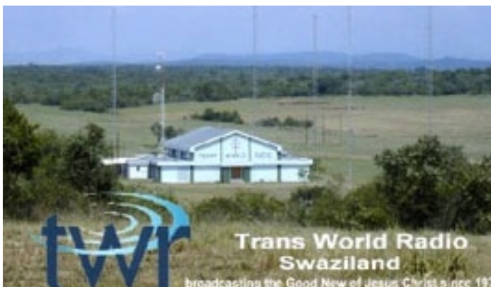
Cartão QSL da TWR –Swazilândia – Sítio transmissor

Sobre esta emissora, sabemos que em novembro de 2008, ela instalou um novo transmissor de ondas curtas, 100 kW de potência, transmissor este construído no HCJB Global Technology Center, em Elkhart, Ind..